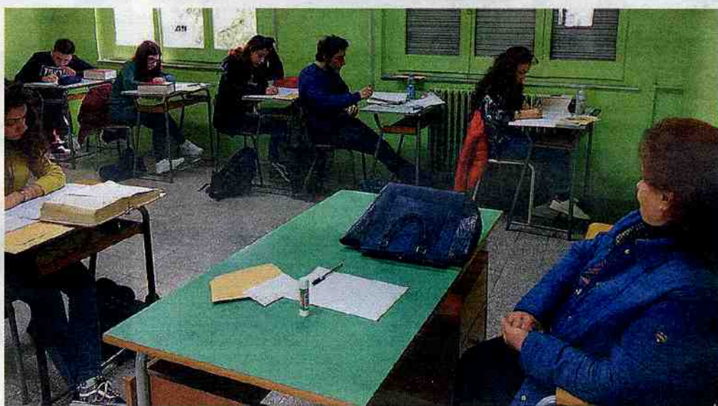
La sfida. I ragazzi provenienti da quindici prestigiosi licei italiani impegnati nella traduzione del brano